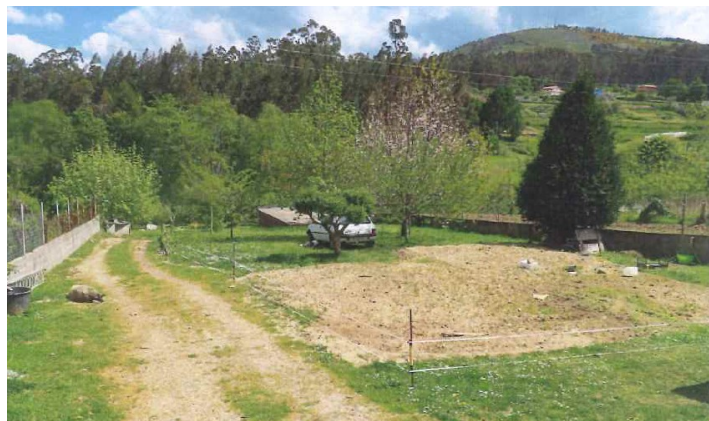
Despois da demolición