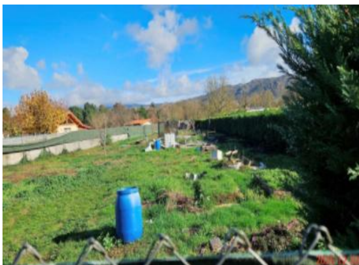
Despois da demolición