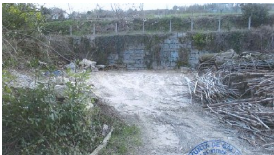
Despois da Reposición