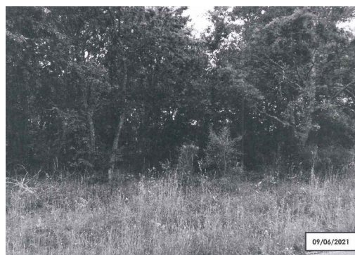
Despois da demolición