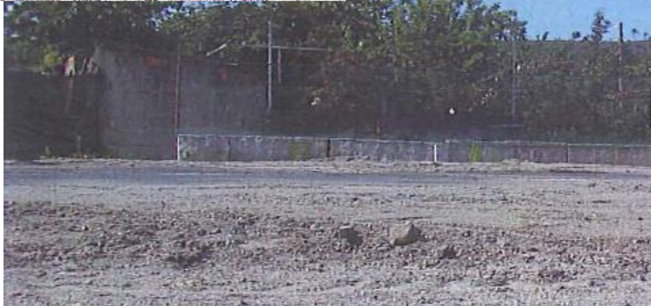
despois da demolición