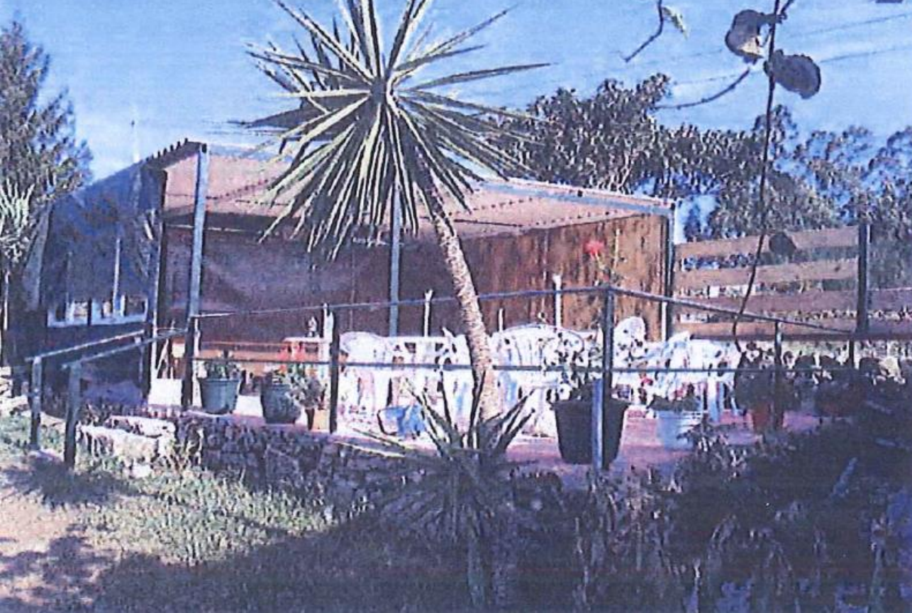
antes da demolição