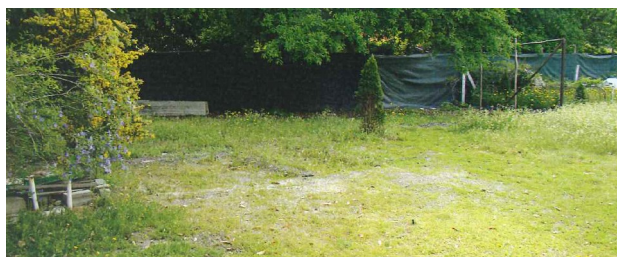
Despois da demolición