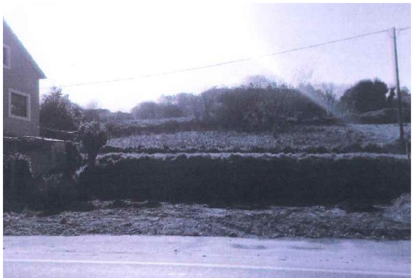
Despois da demolición