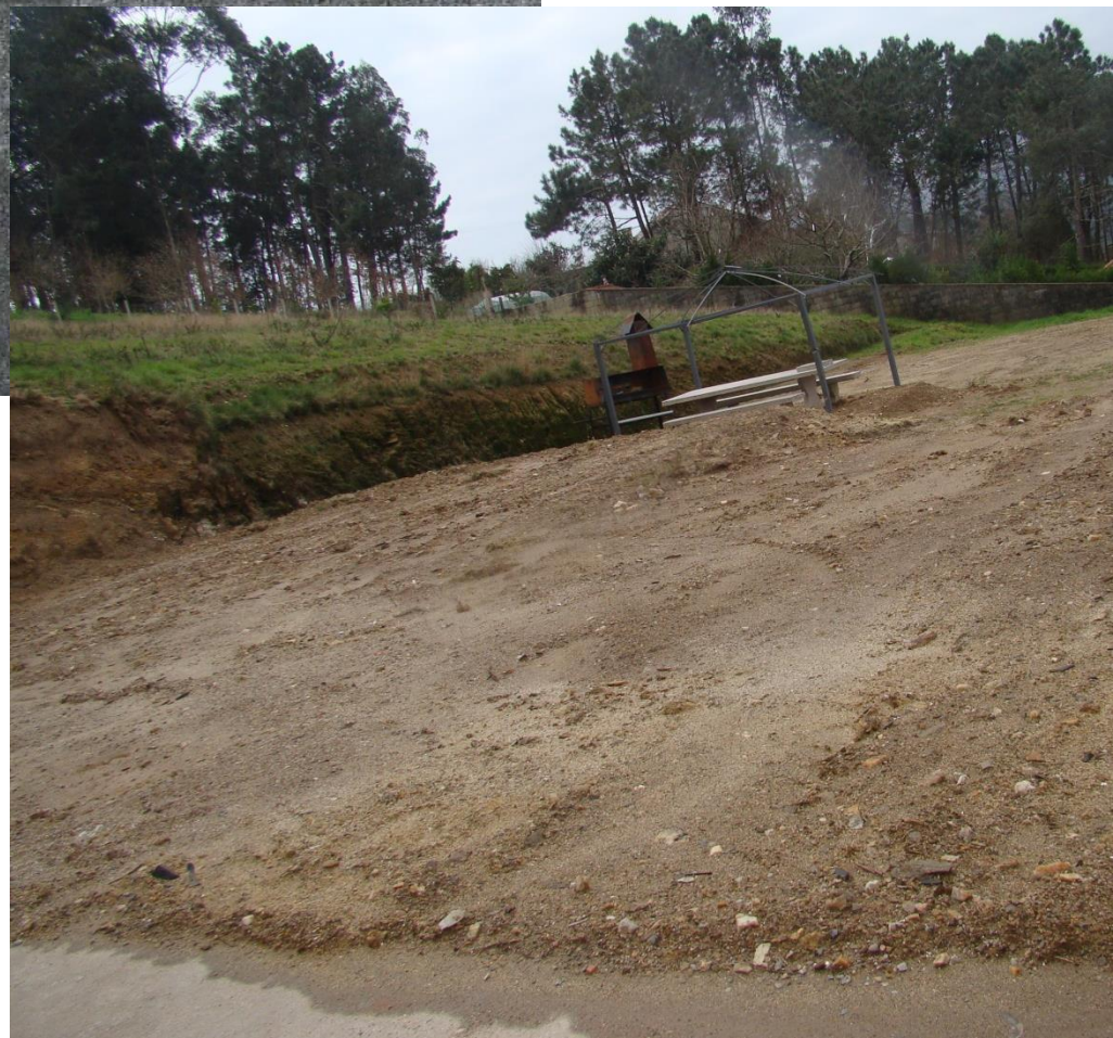
despois da demolición