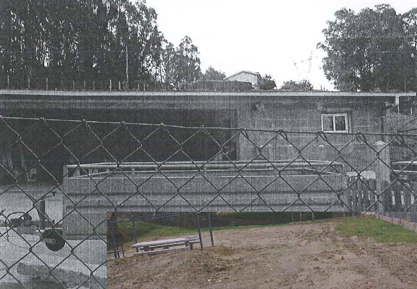
antes da demolição