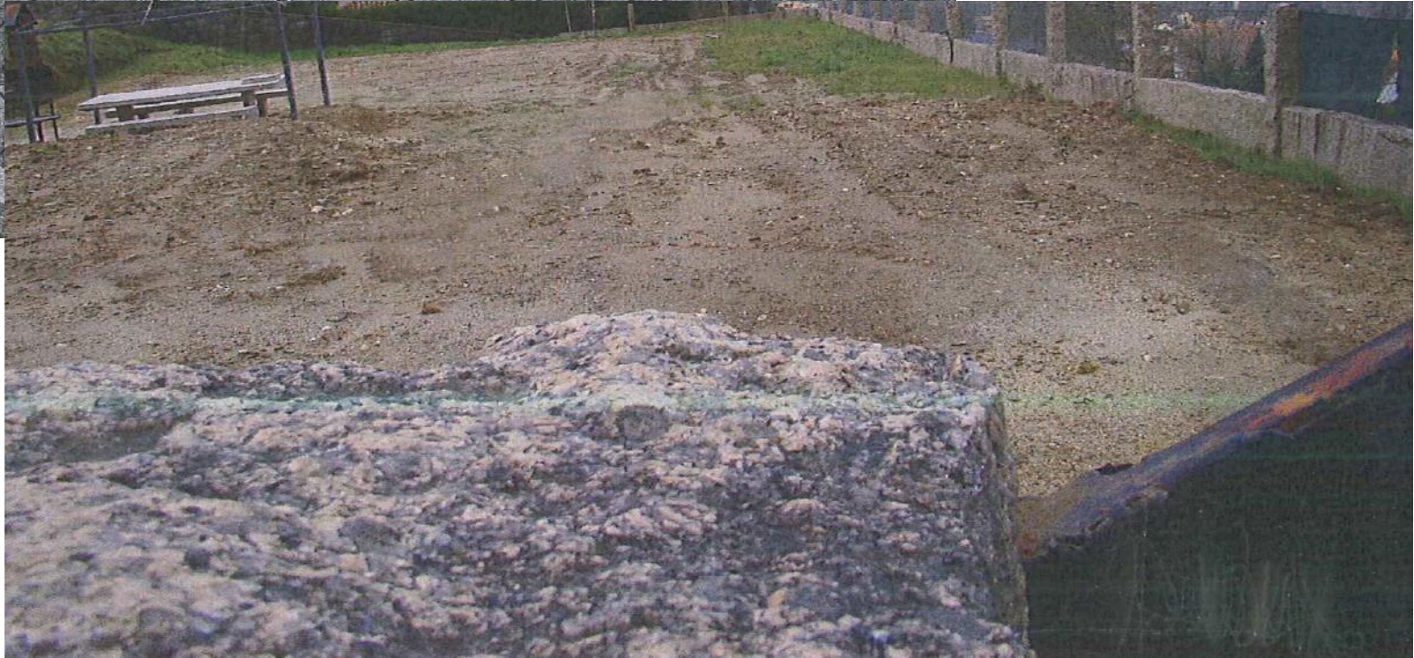
despois da demolição