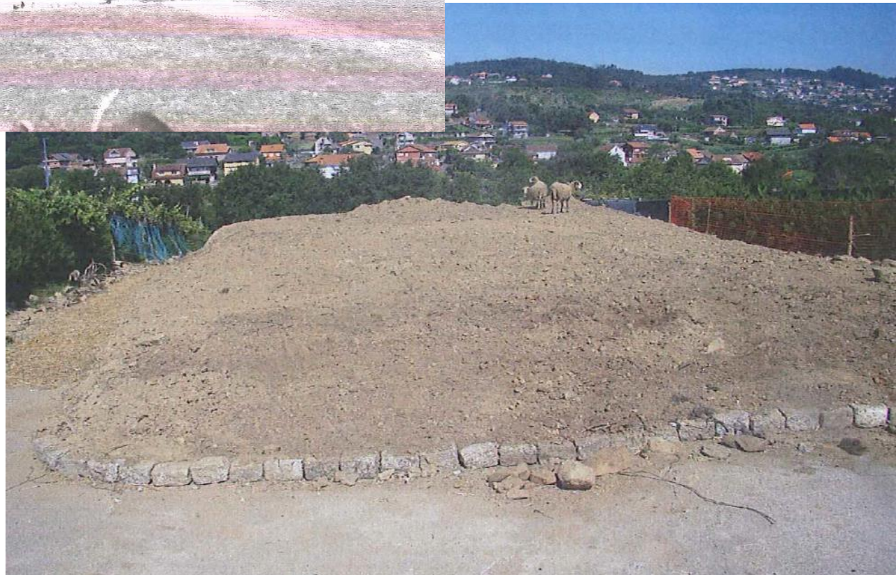
despois da demolición