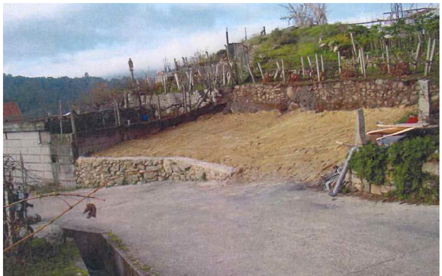
Despois da demolición