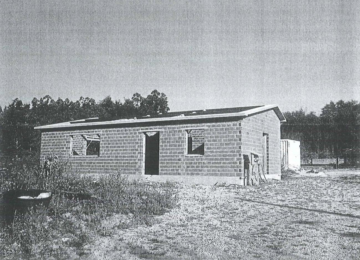
antes da demolição