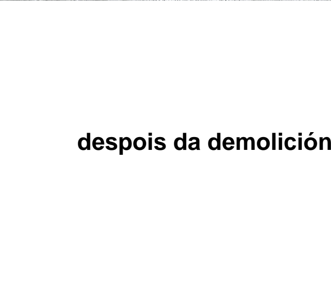
despois da demolição