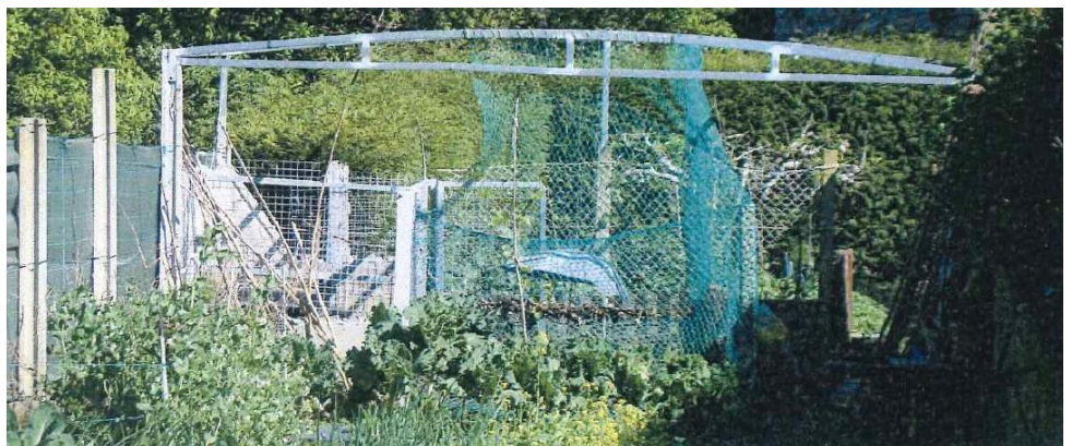
Despois da demolición