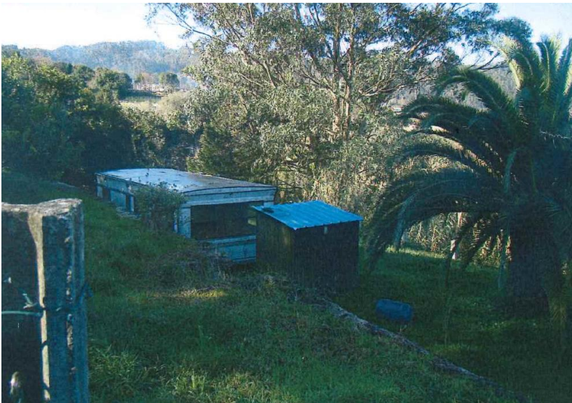
Antes da demolición