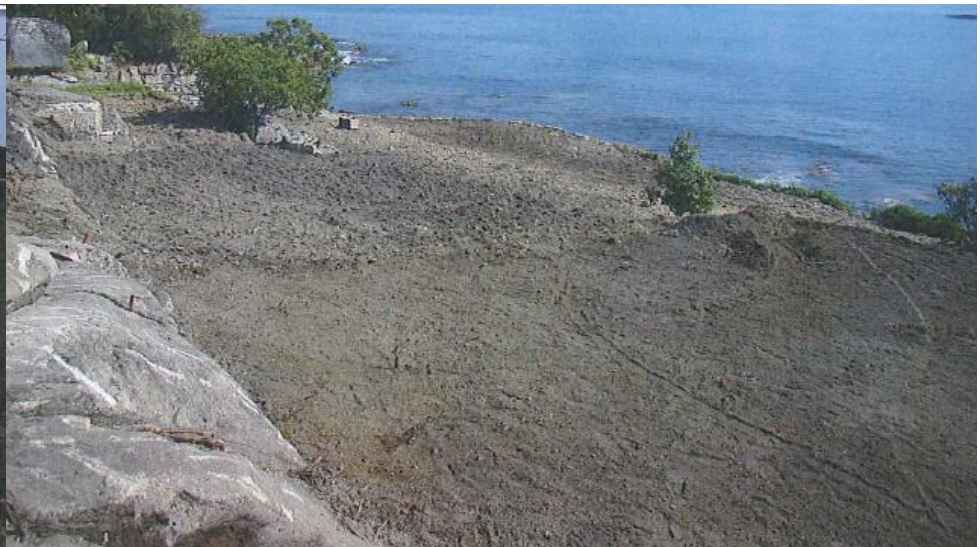
despois da demolición