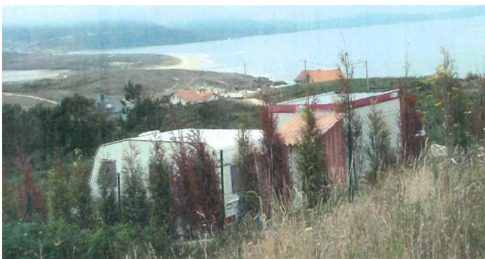
Antes da Reposición