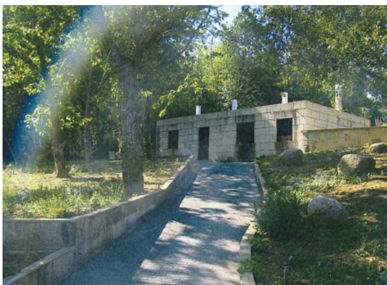
Antes da Reposición