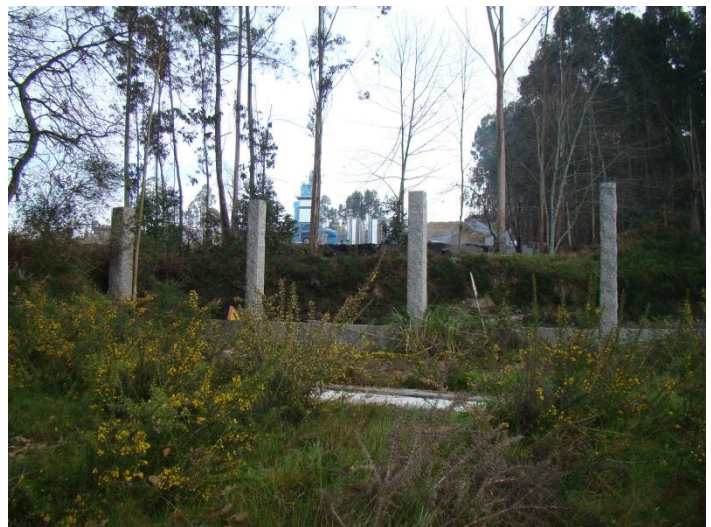
Despois da demolición