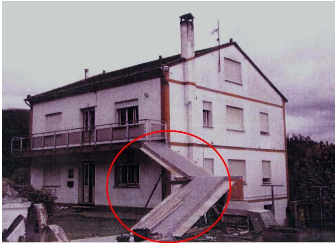
antes da demolición