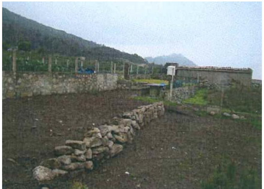
Despois da demolición