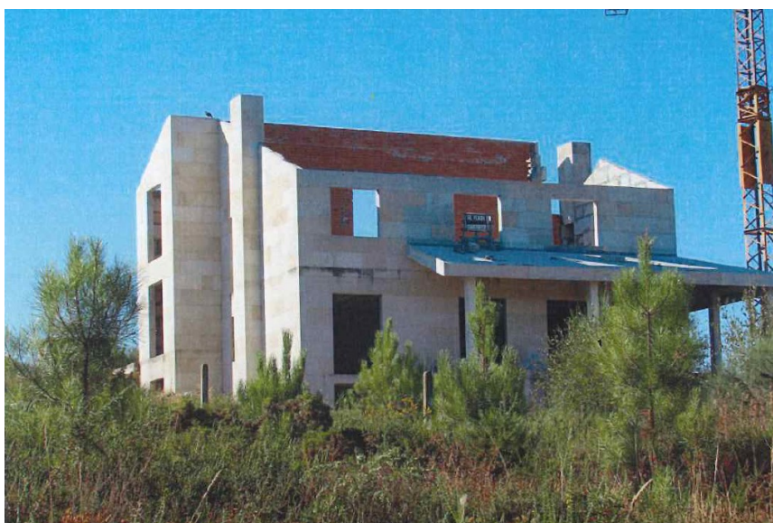
Antes da Reposición