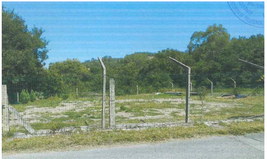
Despois da demolición