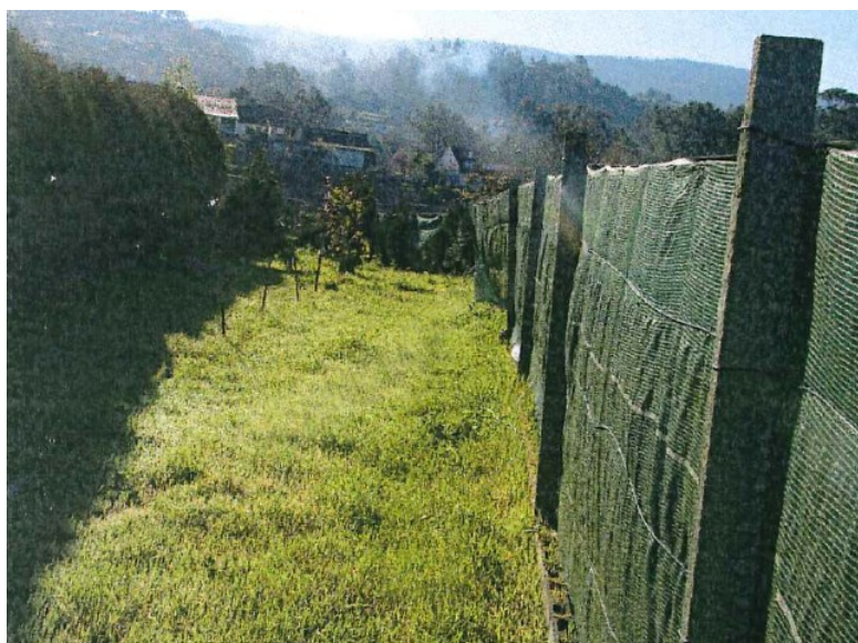
Despois da Reposición