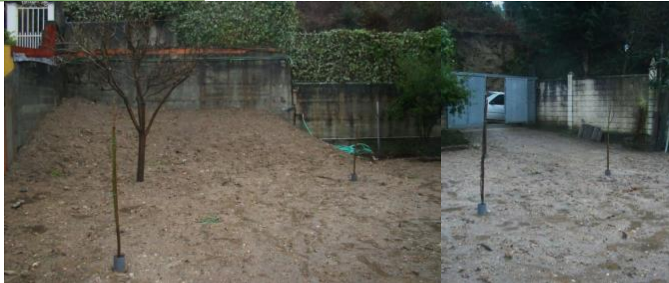
despois da demolição