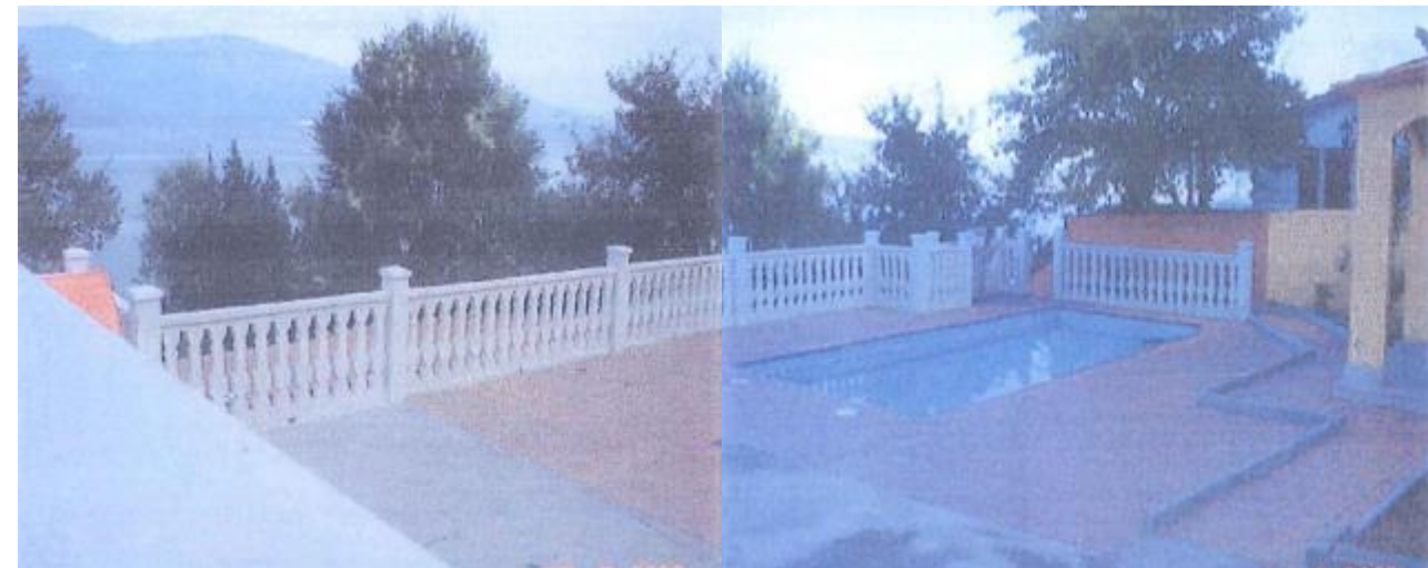
antes da demolición