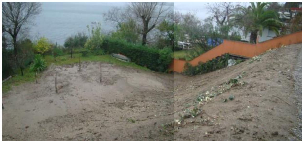
despois da demolición