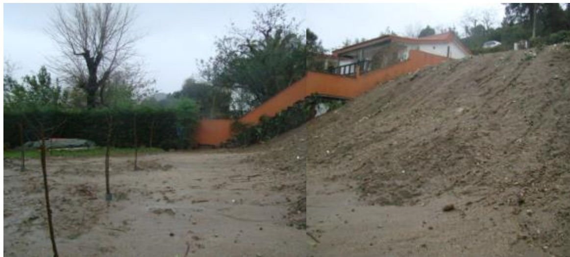
despois da demolición