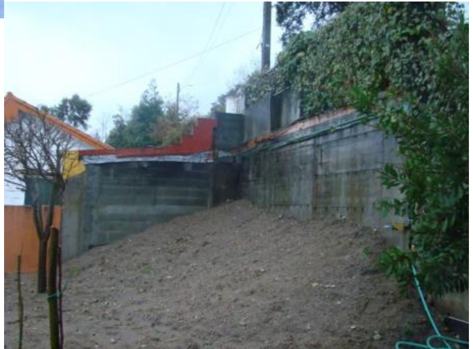
despois da demolición