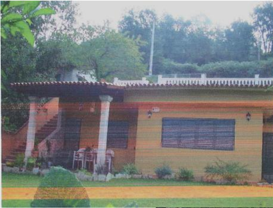
antes da demolição