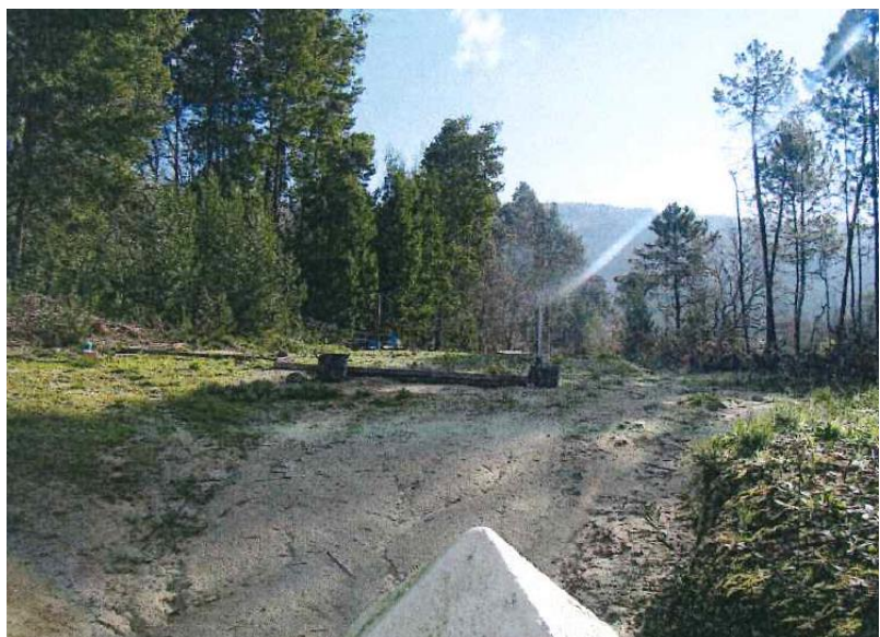
Despois da demolición