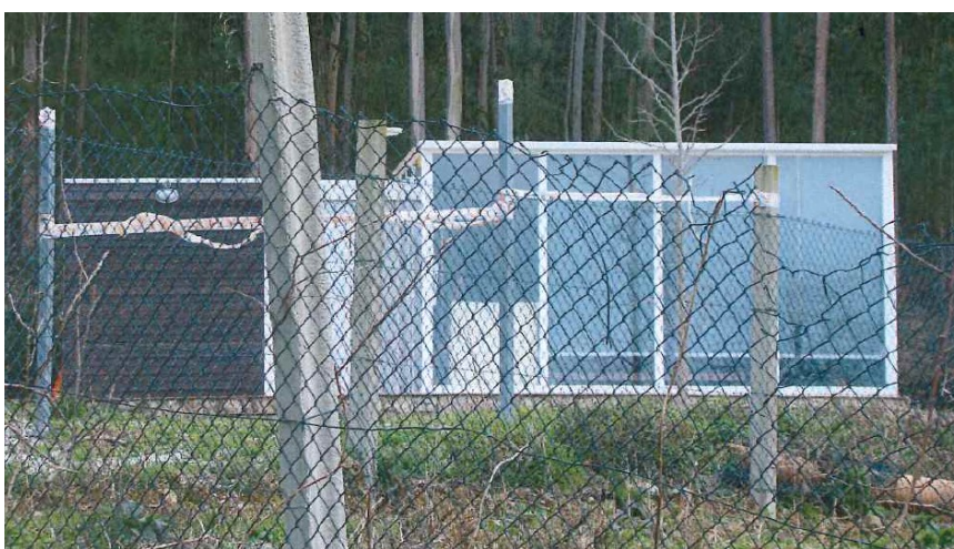
Antes da Reposición